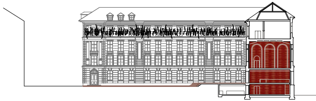
COUPE TRANSVERSALE 1:1000