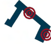
SCHÉMA DE LA DUALITÉ CULTURE ET SANTÉ