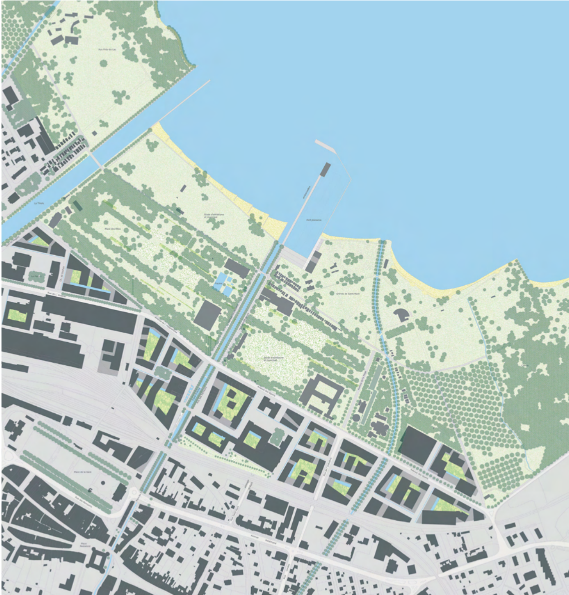
PLAN DE LA VILLE