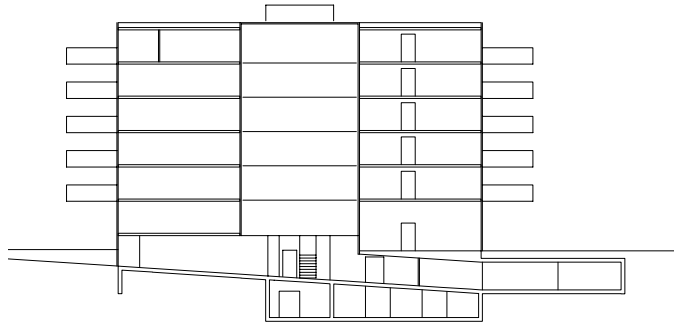
COUPE TRANSVERSALE | UNE RAMPE LÉ- GÈREMENT INCLINÉE RELIE LE GARAGE AU PARC ET AUX ENTRÉES DES DIFFÉRENTS BÂTIMENTS