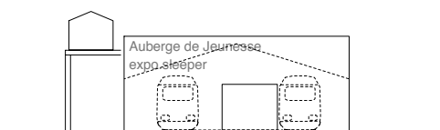
VUE DE L'OUEST | UN MUR ROUGE PRÉCISE L'ENTRÉE DE L'AUBERGE DE JEUNESSE